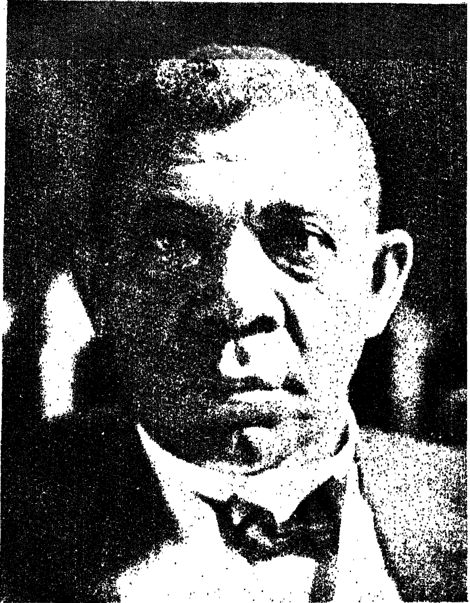
बुकर दी० वार्शिंगटन